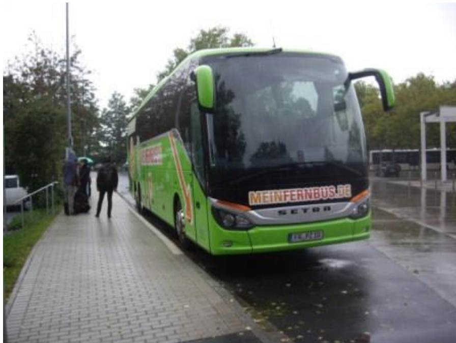
Fahrgäste im Regen stehen gelassen.