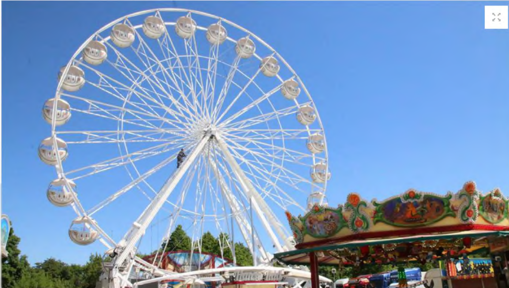
Auf dem Schützenplatz dreht sich in diesem Jahr auch ein Riesensrad: Besucher sind noch bis zum kommenden Sonntag, 13. Mai, auf dem Rummel willkommen.

Das Schützenfest wird am Mittwoch, 9. Mai, mit Maibock-Anstich der Einbecker Brauhaus AG fortgesetzt. Dazu spielt ab 19 Uhr die zünftige Band „El Trinkos“ aus dem Werratal auf. Da ist gute Stimmung programmiert.