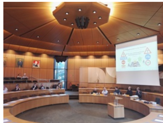
Anwohner der Göttinger Merkelstraße und Interessierte bei Podiumsdiskussion am 18. April (Bild: Lisa Seefeld) der Podiumsdiskussion (Bild: Lisa Seefeld)