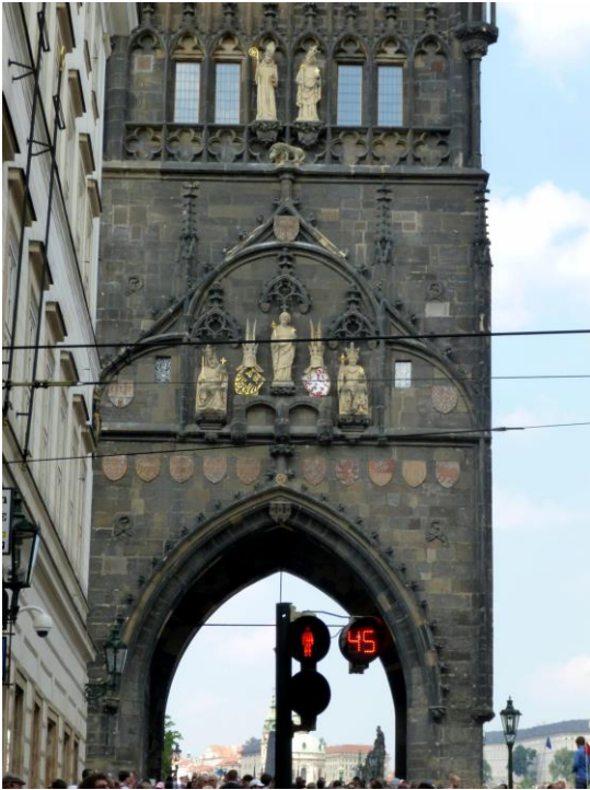
https://www.piratenpartei-goettingen.de/wp-content/uploads/2018/07/P1120721.jpg Prag, 29.5.2018.