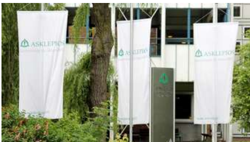
Niederlage für Klinikbetreiber Asklepios: Abmahnungen müssen entfernt werden