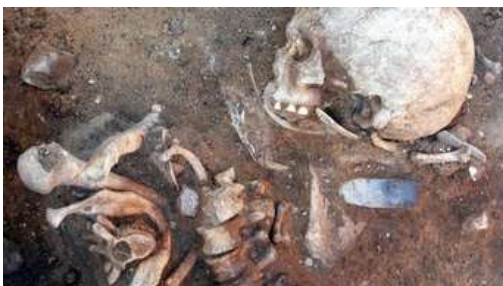
Göttinger Forscher untersuchen ältesten Friedhof Deutschlands