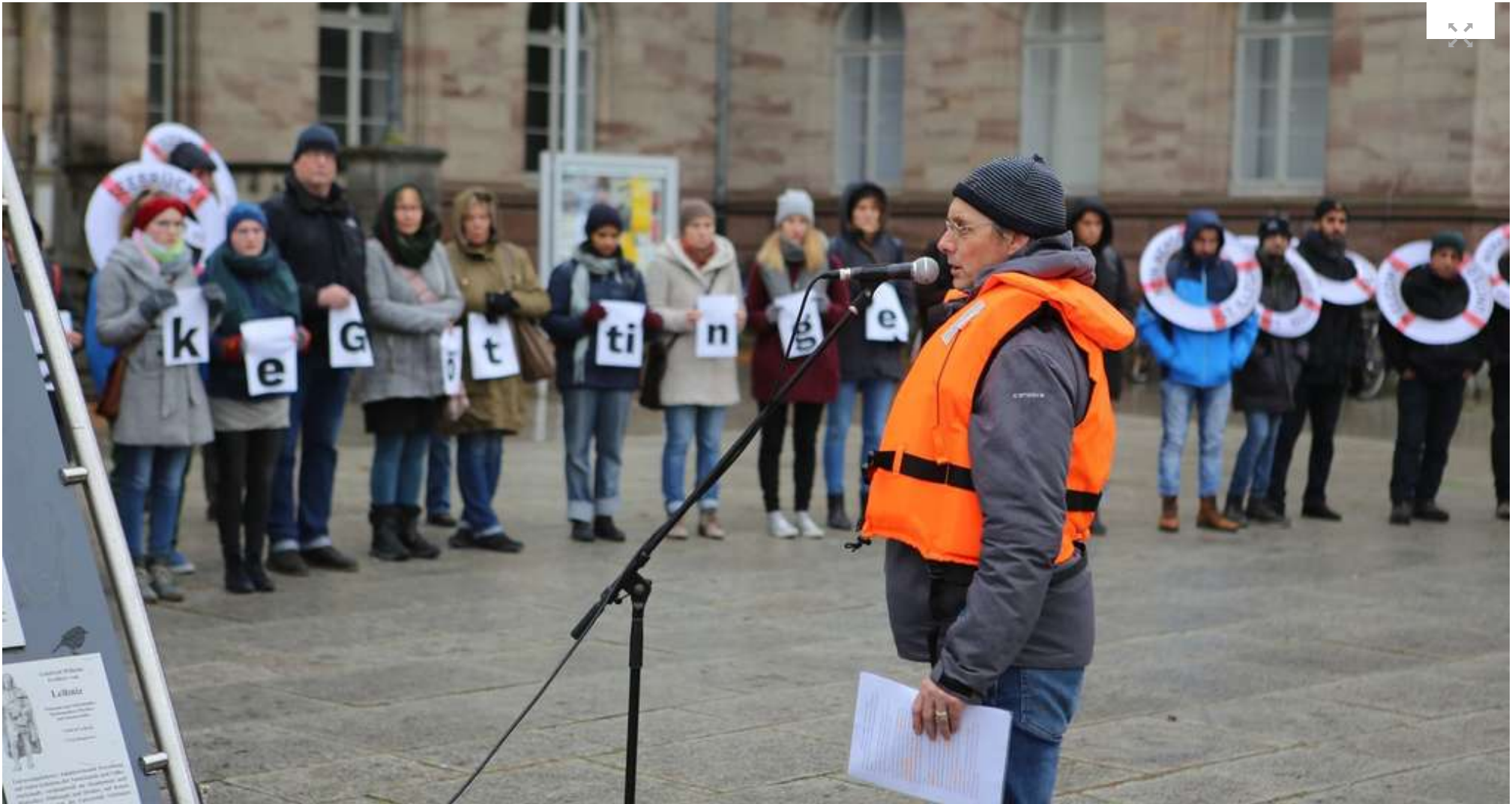
Demonstration: Die Teilnehmer forderten unter anderem, dass die Stadt eine Patenschaft für eines der Seenotrettungsschiffe übernehmen soll.

Göttingen. Göttingen soll ein sicherer Hafen werden: Das ist eine der Forderungen des Göttinger Lampedusa-Bündnisses, das am Samstagmittag zusammen mit der Seebrücke Göttingen zu einer Kundgebung vor das Auditorium am Weender Tor aufgerufen hatte.