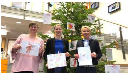
Spendenaktion in Göttingen: Wunschbaum macht Kinderträume wahr